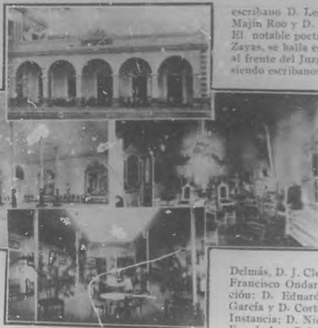
Sociedad "El Liceo" de Cienfuegos.—Fachada del edificio.—Gran salón de fiestas.—Salón de Teatro.—Patio.