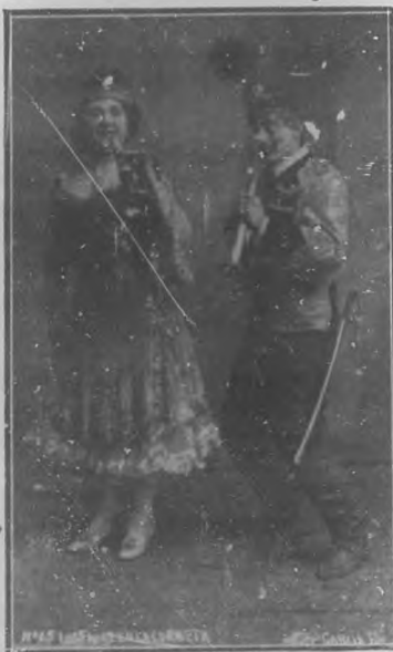
El duetto Fauré que acaba de recorrer triunfalmente las principales ciudades de México y que ha sido contratado para una tournée por toda la Isla.

tros abonados el número de Abril de esta publicación en la cual viene un precioso patrón cortado, modelo de una camisa elegante de señora.