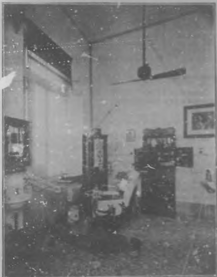
Gabinete de Operaciones