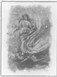
* A Clara Barton *