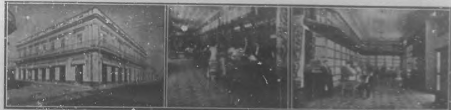
CIENFUEGOS.—La Perla, gran establecimiento de San Miguel y Gavala.—Vista exterior del edificio.—Departamento de Comercio, Industria y Agricultura.—Departamento de Policía.