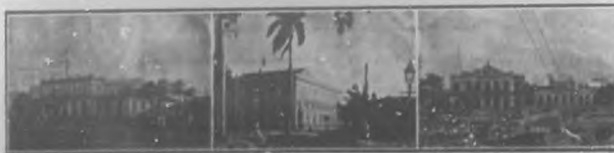
CIENFUEGOS: La Aduna.—El Casino Español.—Parque Central.

pués de aquel período terrible que tan mala fama dió á Cienfuegos. Está al frente de la Alcaldía Municipal un cienfueguero amante de su pueblo natal, un hombre joven lleno de energías y de aspiraciones levantadas. Se llama D. Ceferino A. Méndez y fué al ejecutivo desde el puesto de Concejal por designación de sus compañeros al pasar el ilustre repúblico Dr. D. Leopoldo Figueroa, de la Alcaldía á ocupar su