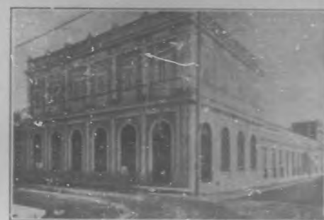
El nuevo edificio del Banco Español de Cienfuegos.—Muestra el anterior estado el edificio, hasta que habiéndose ocupado ya, el prestigioso Instituto de Crédito Banco Español.

También existen con vida próspera: «Delegación del