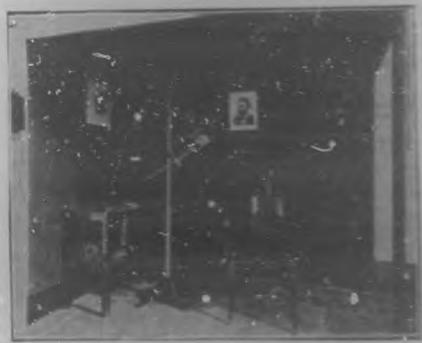
Departamento de Rayos X y electro-terapia