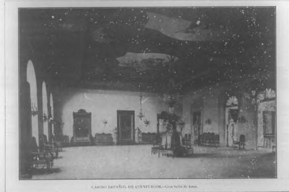
CASINO ESPAÑOL DE CIENFUEGOS.—Gran Salón de Actos.