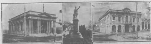
CIENFUEGOS: sucursal del Banco Nacional.—Estatua de Martí.—Palacio del Obispo.