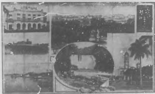
VISTAS DE CIENFUEGOS: Exterior del Teatro Terry.—Castillo Jaguar.—Vista de Cienfuegos desde el Parque.—El Hanabánilla.—La Catedral.