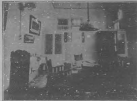
Salón de Lectura

Por falta de espacio nos es imposible publicar el grabado del saloncito de señoras, tocador y lugar de descanso para el caso de cualquier ligera indisposición, del que ya hemos hablado y que es tan lujoso, como elegante y alegre.